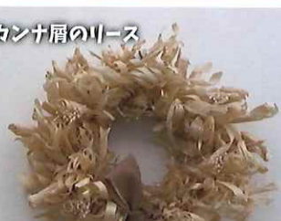
カンナ屑のリース