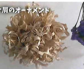
カンナ屑のオーナメント