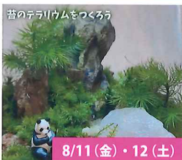
苔のテラリウムをつくろう