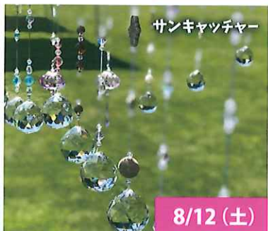
サンキャッチャー